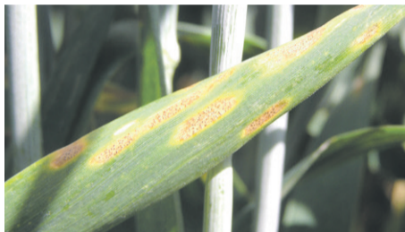
Figur 2 Septoria med synlige pyknider

er smittetryk og hvor meget der er smittet. Den lange inkubationstid gør, at det er vanskeligt at forudsige infektionsniveauet på sprøjtetidspunktet.