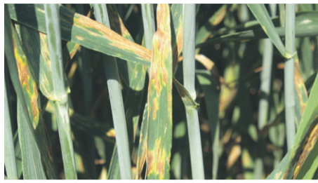
Figur 1 Kraftige tabsgivende angreb af Septoria

På sprøjtetidspunktet kan man se angrebsgrad, men hvad man ikke kan se,