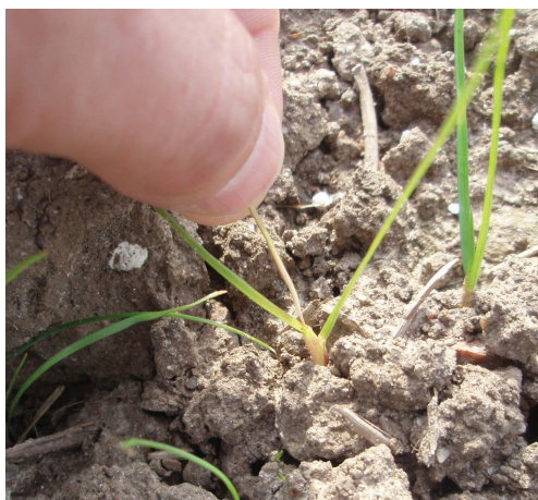
Græs behandlet med Focus Ultra. Bladet i vækstpunktet er misfarvet, og kan nu let trækkes op.

Focus Ultra er meget effektiv mod rajgræs og andre grove græsser*. Hjerteskuddet bliver gulfarvet og slipper fæstet inde i planten. Man kan let trække de nyeste blade op af bladskeden, næsten uden modstand. Den "porrehvide" del får et mat og brunligt skær.